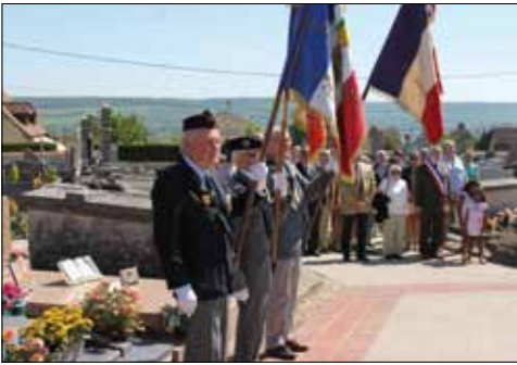
Commémoration du 8 mai 2018

Une commémoration de l'Appel Historique se déroulera lundi 18 juin.