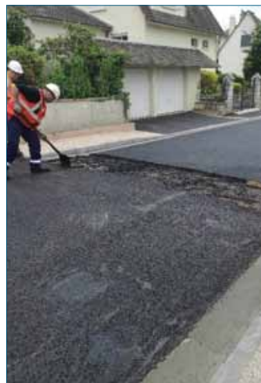
Fin des travaux pour la Route de Chambray (inauguration samedi 23 juin, circulation perturbée à prévoir en fin de matinée) >>