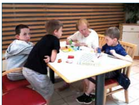
<< Goûter intergénérationnel à la Pommeraie