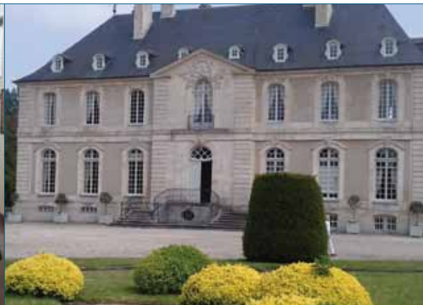
Le voyage des Anciens à VANDEUVRE a réuni près de 300 participants