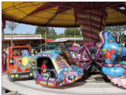
<< Emotions pour la fête de Saint-Marcel