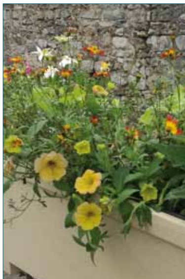
Fleurissement d'été ^^