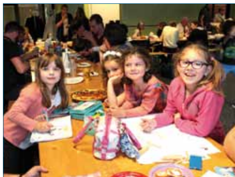
<< Fête des voisins