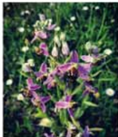
Ophrys abeille ( Ophrys apifera )