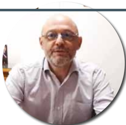
Hervé Podraza, maire de Saint-Marcel