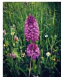
Orchis pyramidale ( Anacamptis pyramidalis )

Merci à Déborah, Saint-Marcelloise et adhérente Cap au vert pour sa participation à l'écriture de ce texte.