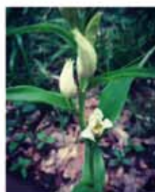
Céphalanthère à grandes fleurs ( Cephalanthera damasonium )