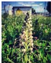
Orchis bouc ( Himantoglossum hircinum )