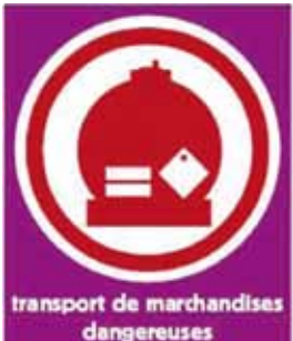
transport de marchandises dangereuses